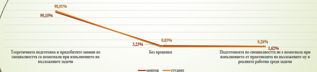
Сравнителна диаграма относно подготовката на практиканта по специалността и изпълнението на възложените му задачи

* Извадка от получените резултати според студентите