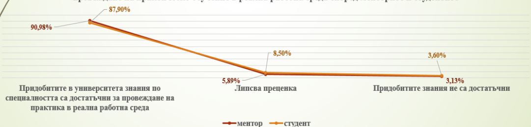
Сравнителна диаграма относно достатъчността на придобитите знания по специалността за провеждане на практическо обучение в реална работна среда според менторите и студентите