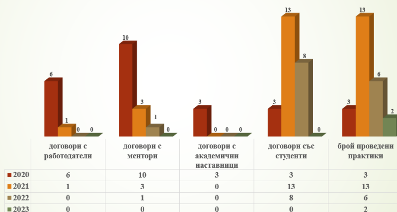
ПН 3.7.Администрация и управление, Стопански факултет