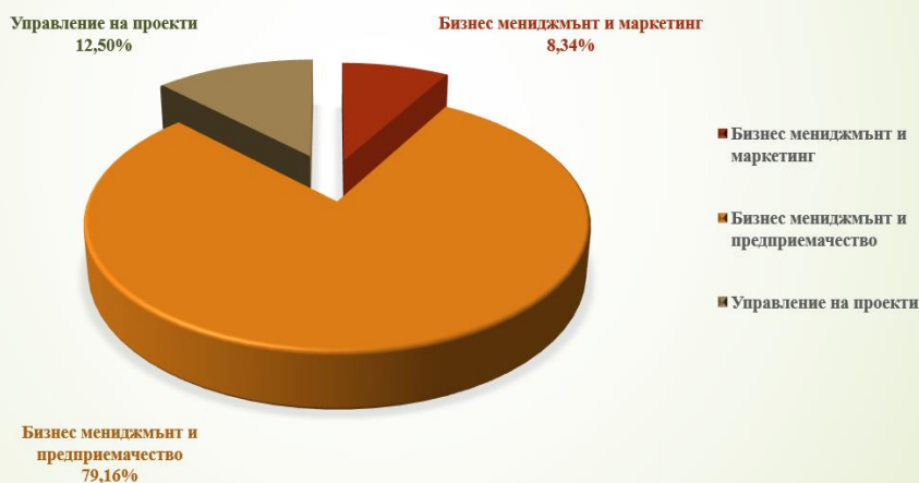
Разпределение на студентите по специалности от ПН 3.7. Администрация и управление към Стопанския факултет, участвали в практическо обучение по проект „Студентски практики – Фаза 2“, НОИР