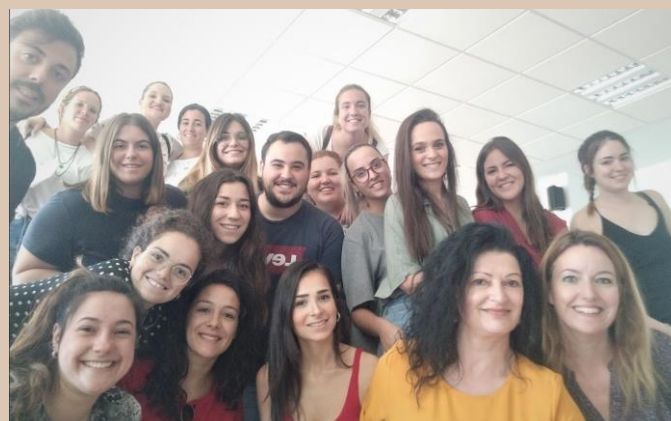
Проведена мобилност по програма "Еразъм+" в университета на Уелва, Испания