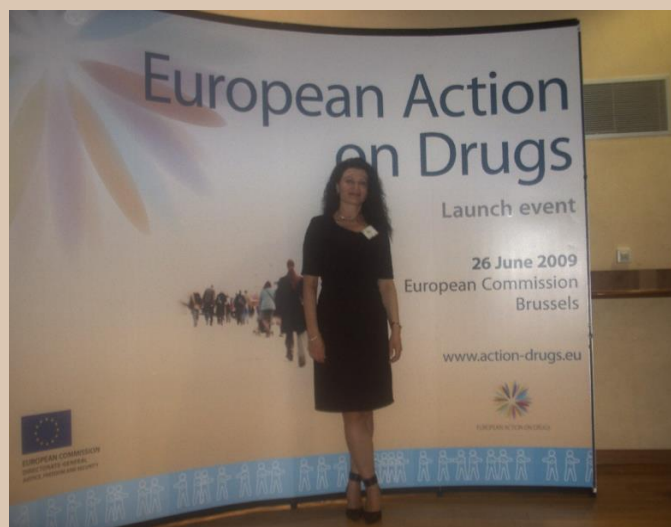
В Европейската комисия пред слогана на кампанията „Европейско действие срещу наркотиците“